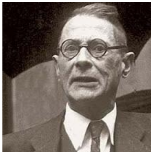
Prof. Henri Wallon